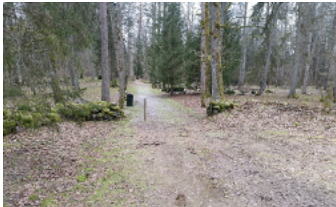
Vargad viisid minema õigeusu surnuaia väravad.

Märjamaa luteri või ka kihelkonna kalmistu, tuntud ka kui Viilumäe kalmistu, ning õigeusu kalmistu on mõlemad