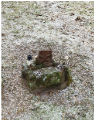
Näide varaste tehtust Viilumäe kalmistul.

„Surnuaia rüüstamine võtab sõnatuks sõltumata sellest, kas tegu on muinsuskaitse all oleva viimse rahupaigaga või mitte. Haudadelt ristide murdmine ja sepispiirde ning värava varastamine on barbaarne ja seda grotesksem, et tegu on