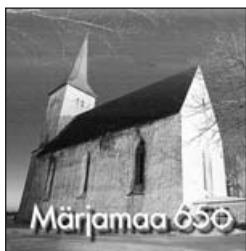
Märjamaa 650 marke saate jätkuvalt soetada Tiina Lilleaiast

Täiskasvanud 2.60 eurot Õpilased, üliõpilased, pensionärid 1.60 € Lapsed alla 7 aasta 0.60 €