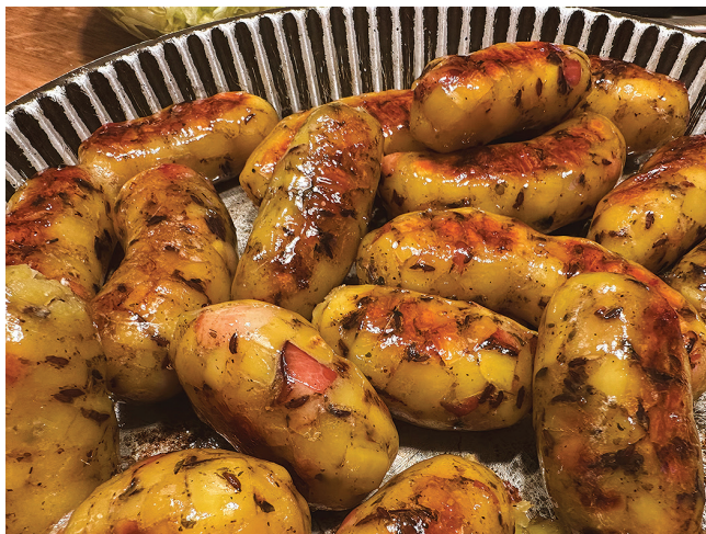
Populaarne pärimustoit Raplamaal on kartullivorst

H ea raplamaalane, kui sul on sahtlipõhjas mõni vanaema kirjutatud retseptivihik või peas mälestus lapsepõlve lemmiktoidust, siis tule seda jagama. Projekt „Põlvest põlve: Raplamaa toidu lugu“ kutsub kogukonnaliikmeid tutvustama oma perekonna toidupärandit ja osalema ühises kooskõkkamises töötoas.