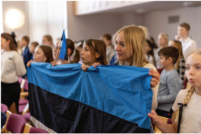
Hümni laulmine Märjamaa gümnaasiumi aktusel.