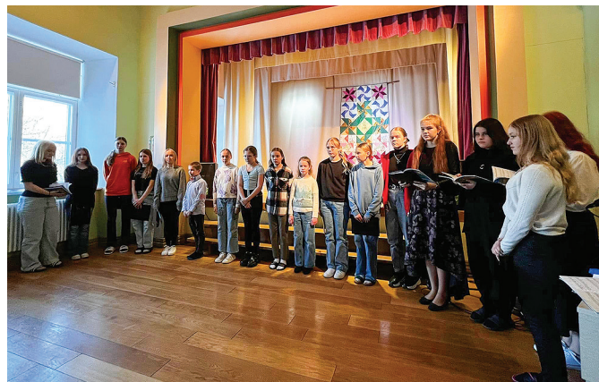
Esineb Valgu põhikooli lastekoor, kes ainsana meie valla koolikoorigest kandideerib üldlaulupeole.