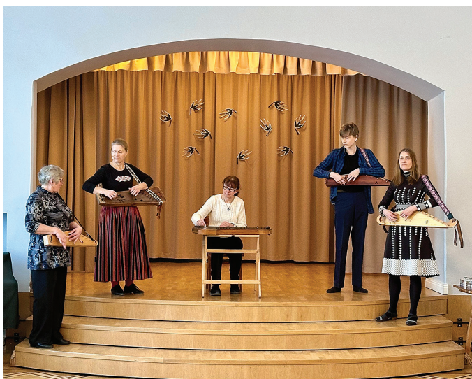
Vana-Vigala põhikooli aktusel esinesid pillimänguga ka õpetajad.

R eedel, 21. veebruaril pidasid meie valla koolid Eesti Vabariigi 107. aastapäeva eel pidulikke aktusi, et minna seejärel koolivaheajale. Kõik selle päeva sündmused olid eriilmelised, just oma kooli nägu.