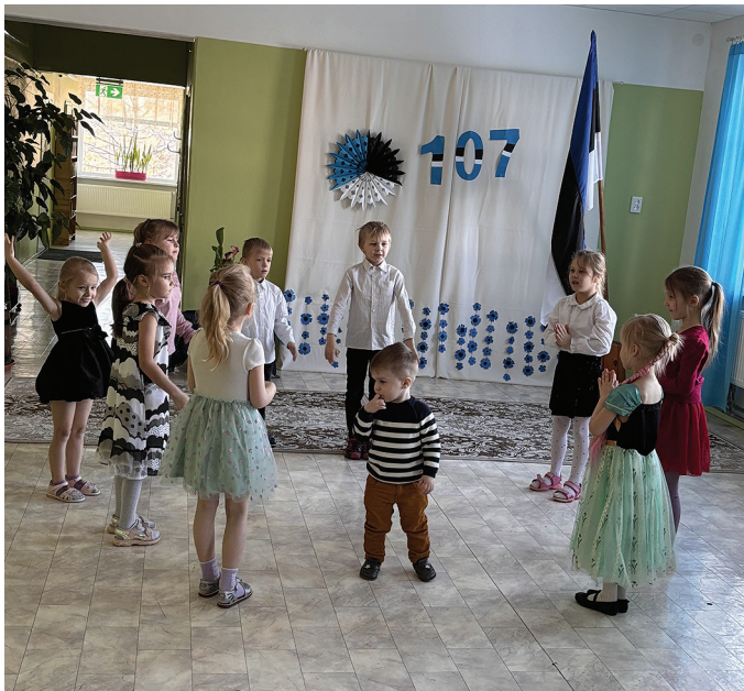
Aktus Varbola lasteaed-alkkoolis.