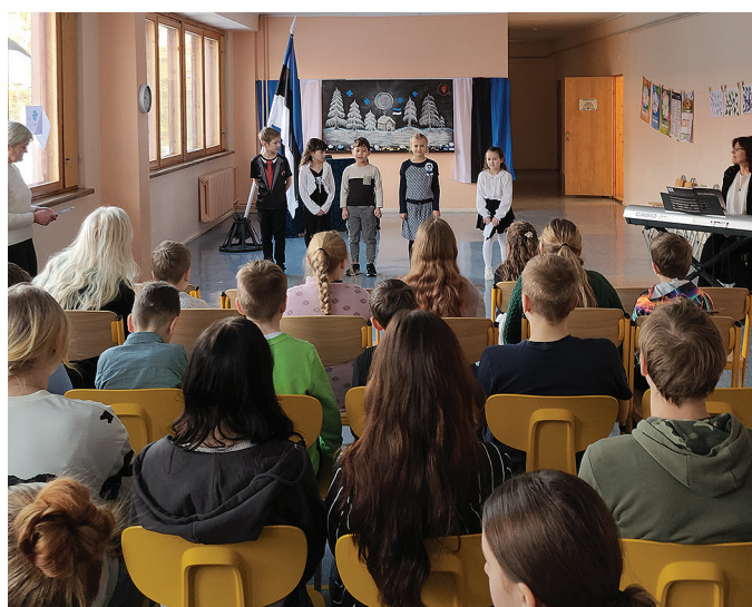
Aktus Kivi-Vigala põhikoolis.