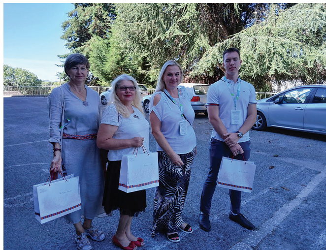
Teel kohtumisele kohalike võimuesindajatega.