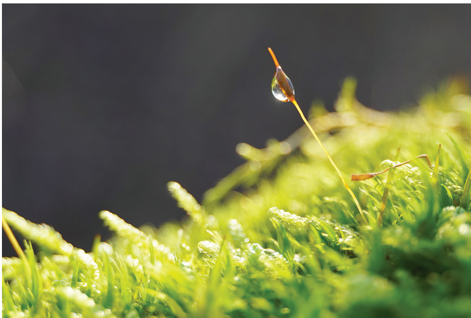
Sügisepisar. Vaimõisa küla

Kui sul on võimalik toetada Vigala kiriku torn-ausamba akende vahetust ja torni korrastamist, siis palun tee seda.