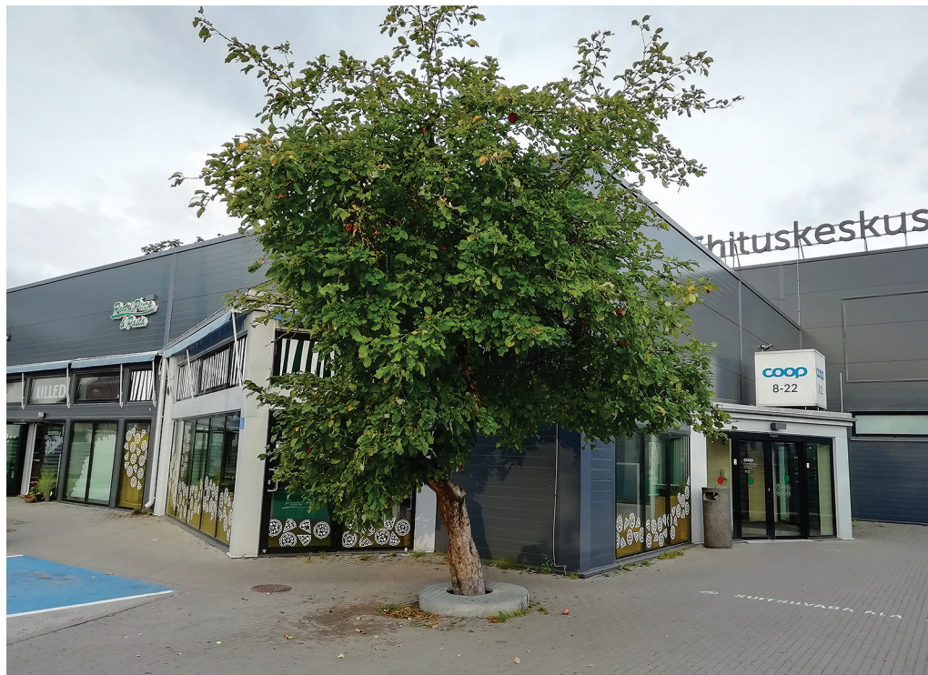
Kasvama jäetud õunapuu Coopi poe juures annab sellele kohale palju ilmet juurde.

Psühholoogid ja feng shui spetsid teavad, et ümbrusel on mõju inimese psüühikale, mõtte- ja hingelaadile. Kui kogu ümbrus on ainult asfalt ja betoon, heal juhul „roheline asfalt“ – muruväli ning tegeliku haljastuse puudumise poolest ja ehituste miljööliselt muljelt