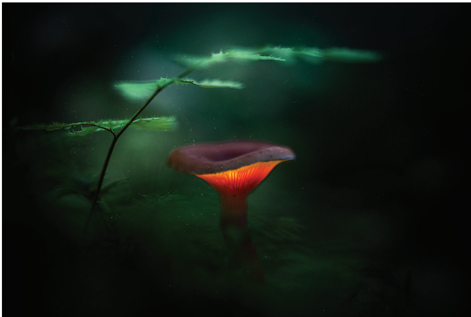
Sügisese metsa muinasjutt. Tiduvere küla