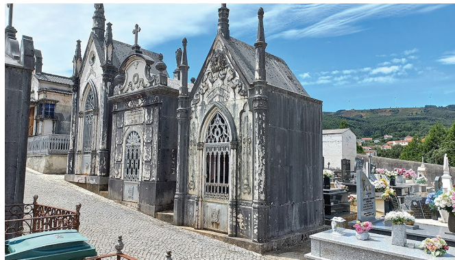
Kohalik surnuaed.

Ilm sattus olema meie reisi jahedaim ja päike oli päris tihti pilve varjus. See oli hea aeg linnakesega tutvuda. Vaatamisväärselt jagus. Nägime muljet avaldavat metsatulekahju mälestusmärki, botaanikaaeda ning kohalikku mausoleumide ja mälestusmärkidega surnu-