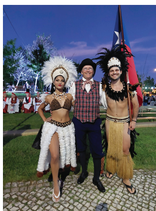
Meeleolukad hetked festivalilt.

Ka tööl olevad rühmad läbisid Serta linna, nii oligi meie esimene peatus hiiglasliku panni juures. Pildistamiseks. Edasi saime juba omal käel linnakesega tutvuda. Vaatamist oli siin vanadel kindlusemüüridel ja tornis, kanali ääres