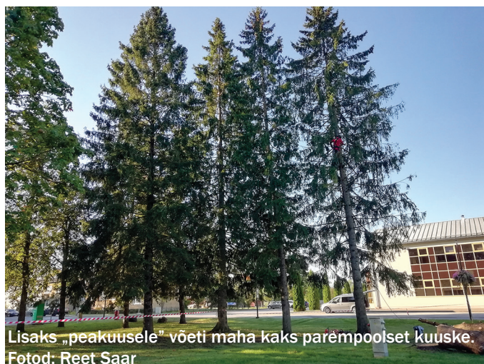
Lisaks „peakuusele“ võeti maha kaks parempoolset kuuske.