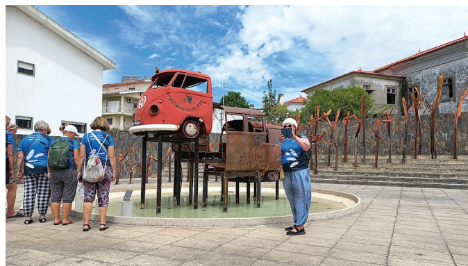
Metsapõlengu mälestusmärk.

Enne iga etteastet tutvustati, kust rühmad tulevad ja millega tegelevad. Kiitsharakate esitluspilt oli varustatud Läti lipuga. Olime üllatunud, aga jätkasime lustiga. Peale esinemist anti korraldus asjad kokku korjata ja bussi minna.