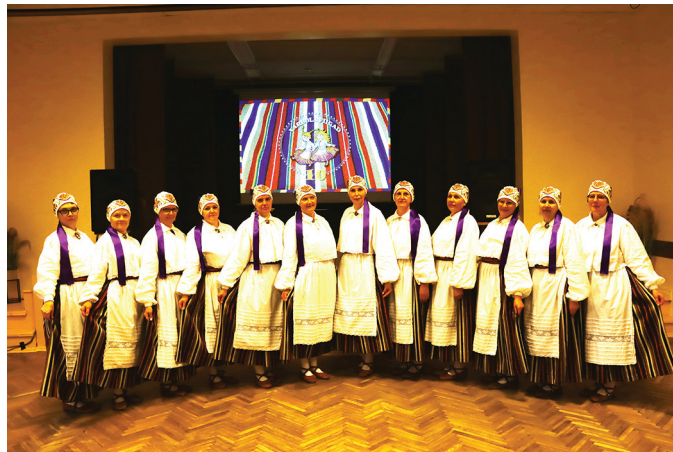
Naisrühm Varbola Piigad.

Varbola Piigade repertuaari on mitmeid tantse, mis Piret