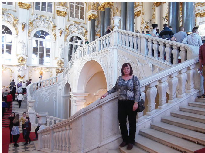
Keset Peterburi palee kulda ja karda.

Millised iseloomujooned on sinu tugevused, mis on nõrkused?