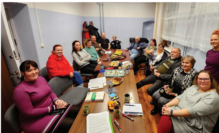
Loodna küla elanike esimene arutelu Sipa mõisas.

Arutelusid veavad eest hõlbustajad. See pisut tavatu sõna on ABCD mudeli jaoks kasutusele võetud moderaatori asemel. Hõlbustajad aitavad arutelusid juhtida ja suunata, kasutades selleks erinevaid meetodeid. Loodna küla hõlbustajateks on Raplamaa Arendus- ja Ettevõtluskes-