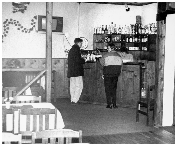
Oti baar Märjamaal 1990ndatel.

Mälukeskuse toodud materjalid on oma laadilt erinevad – leidub trükiseid, vimpleid, laulusõnu, fotosid: „Märjamaa laulupäeva juht 21. juunil 1931“, Tasuja kolhoosi perekklubi Mery vimpel 1980ndatest, Naistevalla küla laulu „Naistevalla hele“ sõnad. 2000ndate algusest on pildid Ankrü baarist Sipas, Ruunavere hotellist, Rangu restoranist. Vaadata saab ka Märjamaa raamatukogus eksponeeritud Harri Jõgisalu isikunäituse digivarianti.