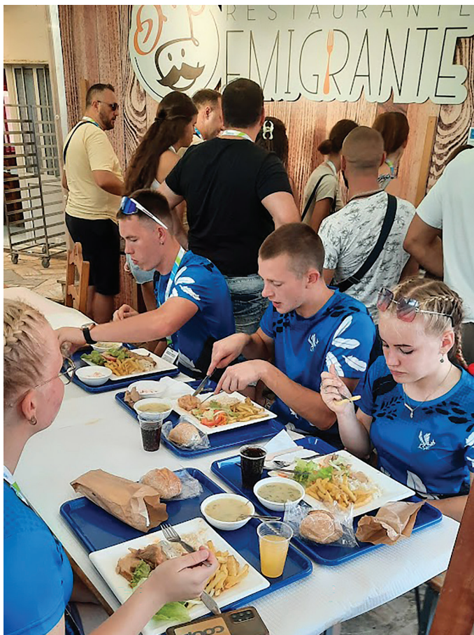
Restorante Migrantes ootas supp, praad ja magustoit.