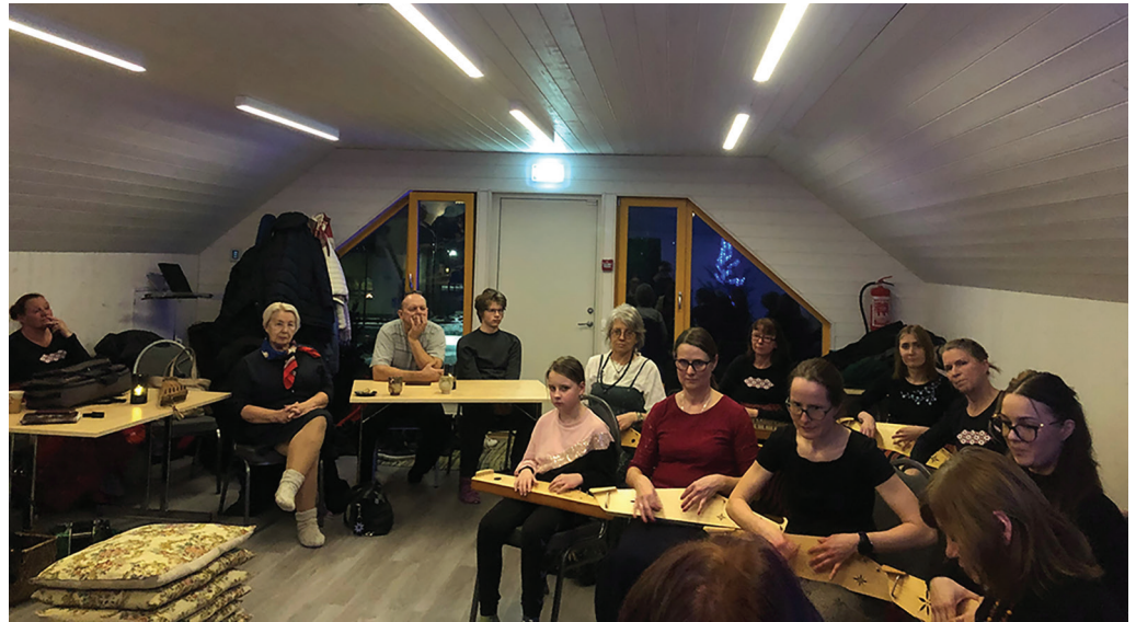
Kandleõhtu pärimusmaja teise korruse ruumides.