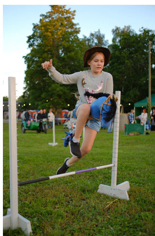
Kepphobuste võistlusel lustisid lapsed ja täiskasvanud.