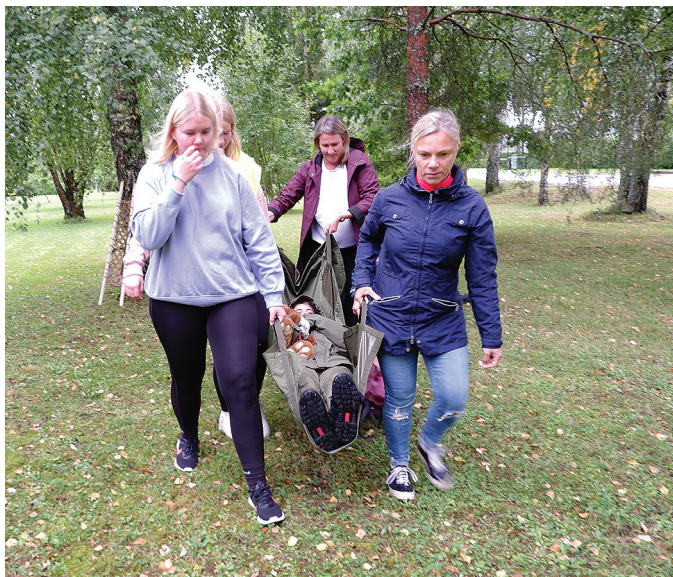
Võistkond Piigad transpordib kannatanut.

Siin tutvustati päästeveste ja jagati veepäästega seotud tarkusi. Kõige selle kõrvalt jõudis sõbralikke koeri paitada. Gümnaasiumi juures tuli lauatenisreketele asetatud kerge palliga läbida slaalomirada nii, et pall reketilt maha ei kuku ja teises käes hoitud klaasist vesi välja ei loksu.