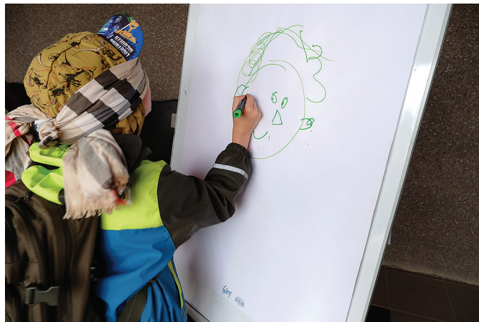
Kaaslaste juhendamise abil kinnisilmi portreed joonistamas.

Järtade juures ootasid kolm hiigelsuurt vetelpäästekoera ja MTÜ Märjad Käpad liikmed.