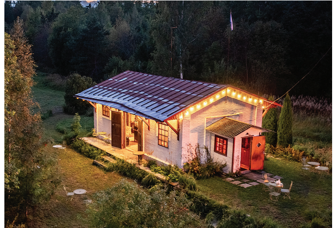
Raudteeait drooni pilguga.