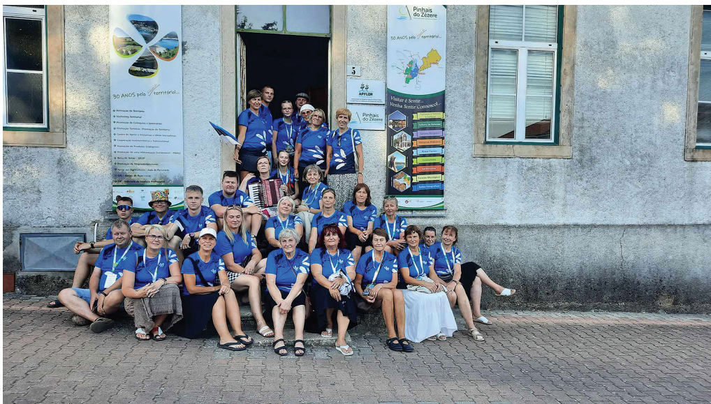
Kiitsharakad Portugalis linnavalitsuse ees poseerimas.

Vigala folklooriselts Kiitsharakad lõpetas oma suvehooja seekord Portugalis, osaledes rahvusvahelisel Raizes Folk Festil, mis toimus 11.–17. augustini. Korraldajateks ja võõrustajateks oli Cernache do Bonjardim folkloorigrupp. Festival kuulus rahvusvahelise folkloorifestivalide ja rahvakunsti organisatsioonide nõukogu (CIOFF) nimistusse. CIOFFi egiidi all toimuvaid festivale korraldatakse aasta jooksul eri riikides mitmeid. Raizes Folk Festil olid esindatud Eesti, Serbia, Tšiili, Uruguai Mehhiko ja Portugali rühmad. Kokku anti ette seitsme kontserti.