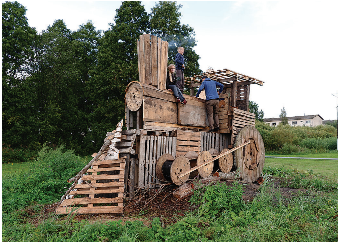
Euroalustest ja kaablrullidest valmistatud vedur oli lastele huvitav turnimiskoht.