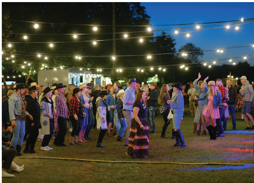
Kantripidu ja rivitants kuuluvad kokku.