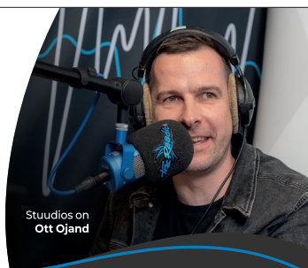
Studios on Ott Ojand

Iga päev Raplamaa teemad, uudised ja sündmused!