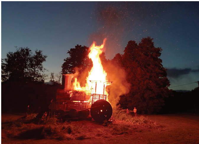
Vedur leekides. Pimeduse taustal näitas end Tulekurat.

M uinastulede süütamise tava sai alguse 1992. aastal Eesti ja Soome rannikul ning hiljem on liitunud sellega teised Läänemere maad. Ennekõike süüdatakse