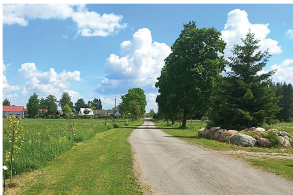
Vaade Pärandalleele.