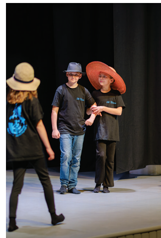
Noorema vanuseastme laureaat on Rapla Vesiroosi kooli teatristuudio Ega Vist lavastus „Üheskoos“.

Kolmandate klasside õpilased esitasid Aino Perviku