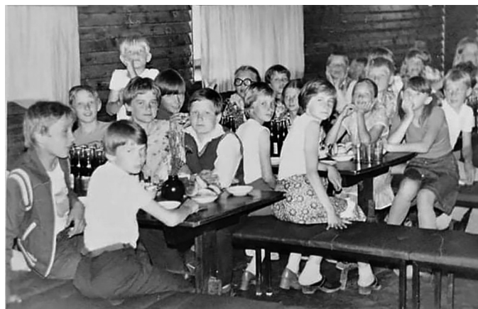
Laukna lasteklubi Cipoliino lapsed tegutsesid sovhoosi kontorihoone keldrikorrusel asuvas kaminasaalis, kus oli ajutine kultuuriürituste toimumise koht. Foto on laste üritusest 1980ndate teisel poolel.