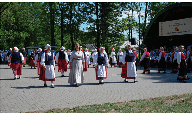
Valgu seeniortantsurühm Valgu Vallatud.