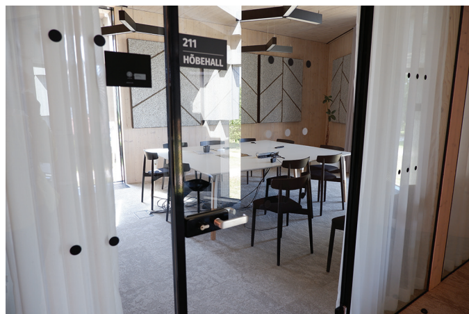
Höbehallides toonides nõupidamisteruumi seinal on heli summutamiseks moodne okkavaip.