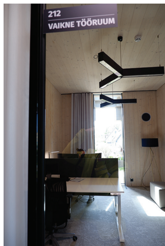
Vaikne tööruum.

Ülevaate väljaandest tegi valla avalike suhete juht Sirje Piirsoo. Saue Valdur ilmub kaks korda kuus, 24 numbrit aastas. Trükiarv on 11 500 eksemplari, A3 formaadis lehe maht on 12–16, vahel ka 20 lehekülge. Leht jõuab vallas tasuta igasse postkasti. Sa-