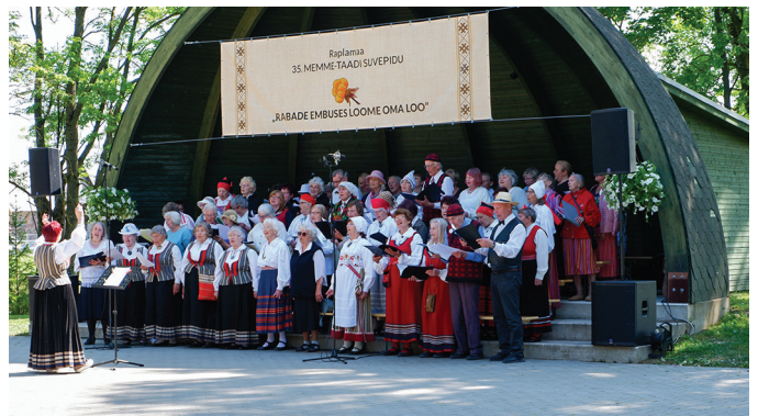
Lauljate hulgas on Haimre naisansambel Viisitarid, Kivi-Vigala lauluansambel Hõbejuus ja Märjamaa sotsiaalkeskuse lauluklubi Kukemari.