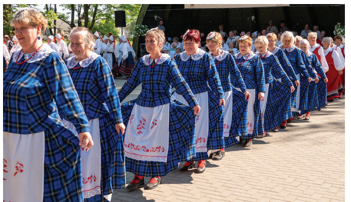
Märjamaa naisrühm Viimikud.