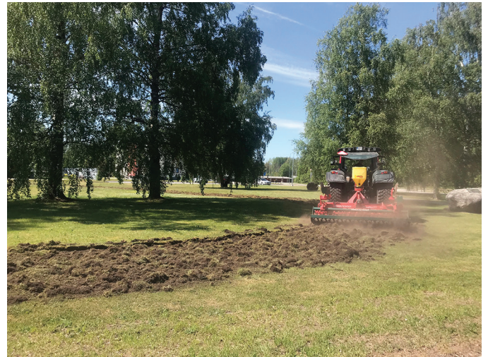
Lilleniidu rajamine vallamaja ja ujula vahelisele haljasalale.

Erinevalt tavapärastest sademeveetrassidest kasutatakse kogutud ja puhastatud sademeveet elurikkuse säilitamiseks ning seotakse CO 2 . Kogumistiigina kasutatav betoonpõhjaga tiik rekonstrueeritakse projekti raames. Tulevikus ei laske tiik lokaalselt sademeveel imbuda, vaid annab võimaluse kogutud sademeveet kasutada lähiumbruse haljastuse kastmiseks. Liigirohke roheline haljastus on elupaigaks väiksematele lindudele, putukatele ja kahepaiksetele. Sidus ja heas seisundis rohealade, ökosüsteemide, koosluste ja liikide võrgustik on kliimamuutuste mõjule