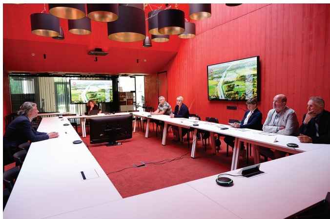
Saue vallavolikogu saalis peetakse kõiki suuremaid koosolekuid.

muti on leht veebis loetav nii pdf-ina kui ka artiklite kaupa. „Leht peab olema nii hea, et inimesed oleksid valmis seda ka ostma,“ ütles vallavanem. Samas tasulist varianti või si-