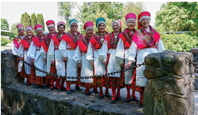
Kivi-Vigala tantsurühm Kullerkupp.