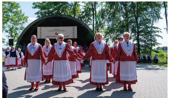
Haimre naisrühm Labajalg.