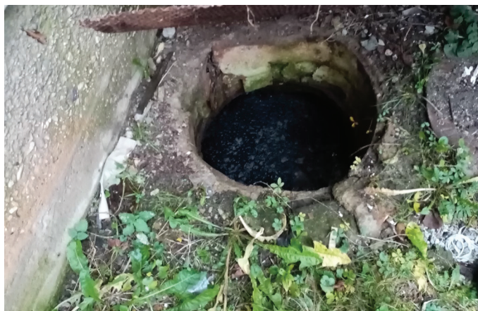
Märjamaa alevis oleva maja põhjatu kogumissüsteem.

Antud nõue on inimeste enda tervise kaitseks, vastasel juhul võib või näiteks naabri või enda kaevu reostada. Reostunud põhjavesi võib jätta jälje tervisele. Mikrobioloogili-