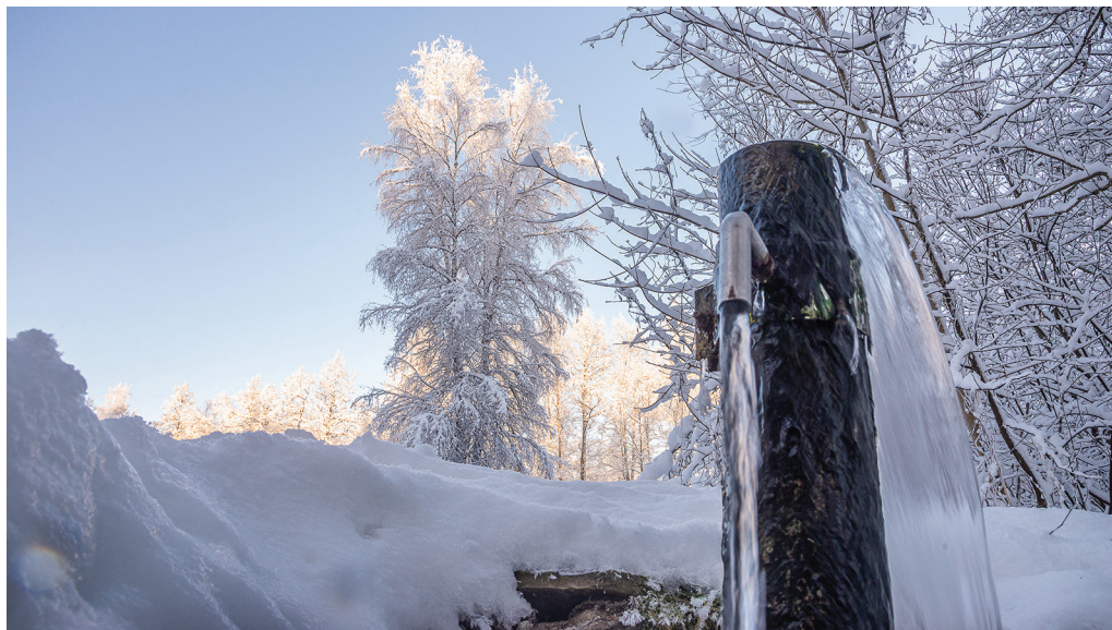
Puhas põhjavesi on elu alus. Joošva allikas Paekülas.