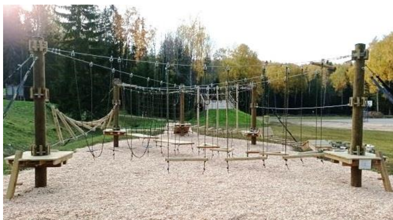
Pilt on illustratiivne!

2023. aastal kuulub realiseerimisele ettepanek „ Madalseiklusrada Vana-Vigala Põhikooli juurde “.