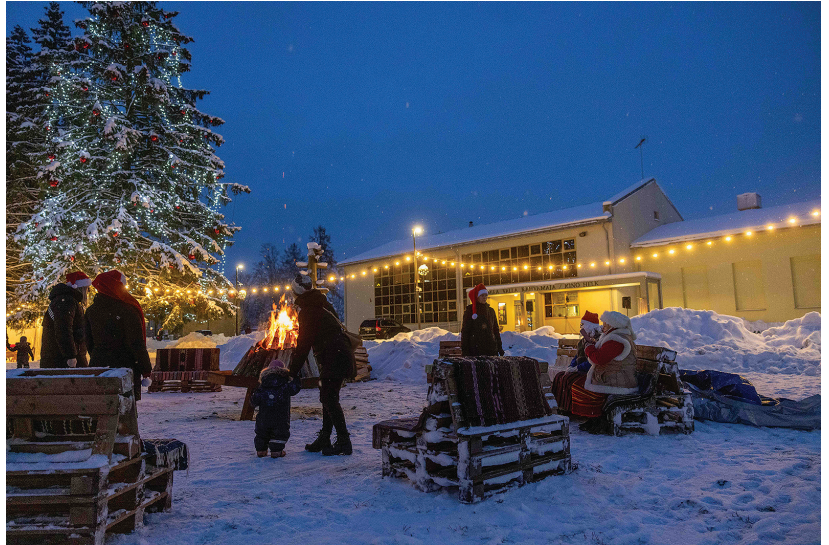
Jõulumaa Märjamaa keskväljakul muutus õhtupimeduses eriti muinasju- tuliseks.

„Raplas ja Kohilas on oma jõulumaad korraldatud juba mitu aastat. Mõtlesime, kuidas Märjamaa keskväljakut talvel kasutada ja pakkuda siin huvitavat tegevust. Meil korraldajatenä oli tore ja loodan, et neil ka, kes jõulumaal käisid. Kohtume järgmisel aastal jäl-