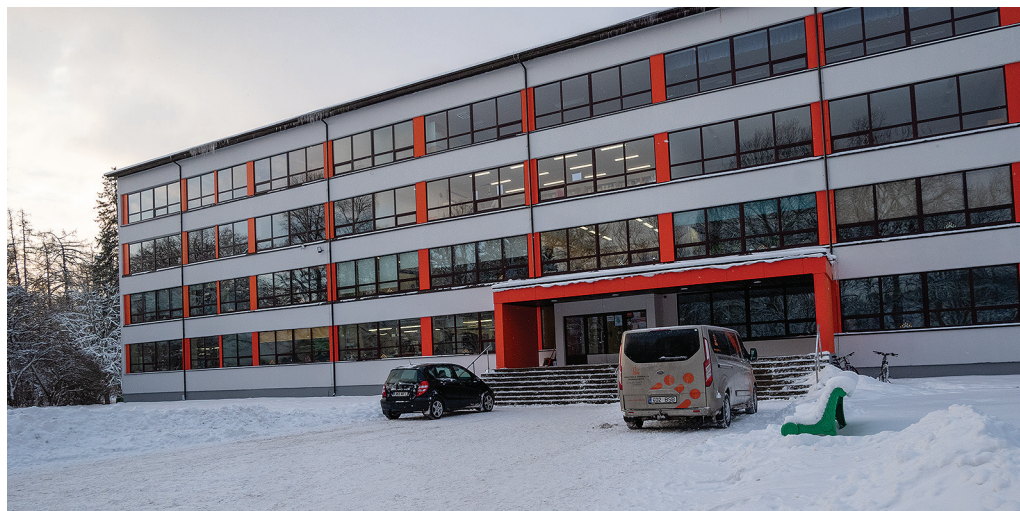
Vana-Vigala tehnika- ja teeninduskooli fassaad sai peale pikka ootamist tänavu korda.

Plaanitud töödest jäi seekord välja välistrepp, kuna