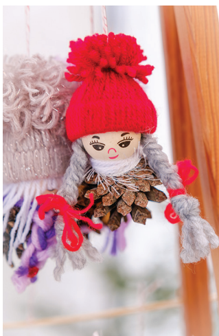
Korraldajad olid suure hulga väikseid päkapikke valmis teinud, aga neid sai kohapeal ka ise meisterdada.