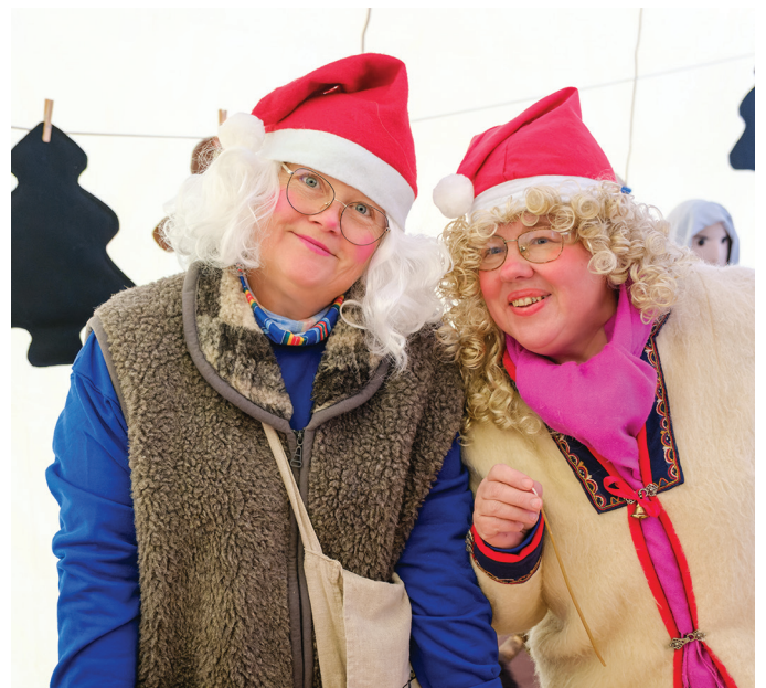
Kaks lustakat jõulumemme. „Kas sa oled päris?“ küsis üks laps jõulumemmel. „Päris-päris! Katsu, mu käed on täitsa soojad,“ vastas memm.