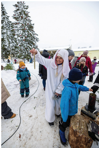
Käsil on küünalde kastmine