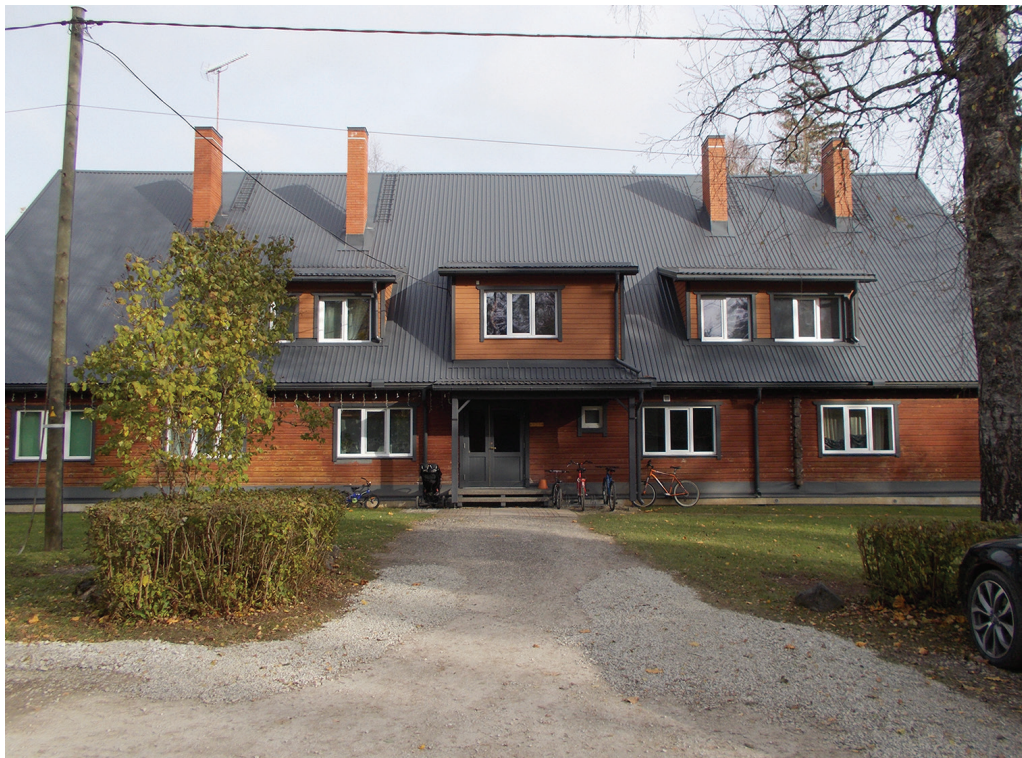
Kunagine palvemaja, praegune elamu aadressil Pärnu mnt 131 pärast renoveerimist