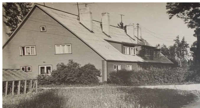
Korterelamuks ümber ehitatud palvemaja 1970. aastatel.