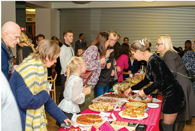
Lapsevanemate korraldatud kohviku valik oli rikkalik.