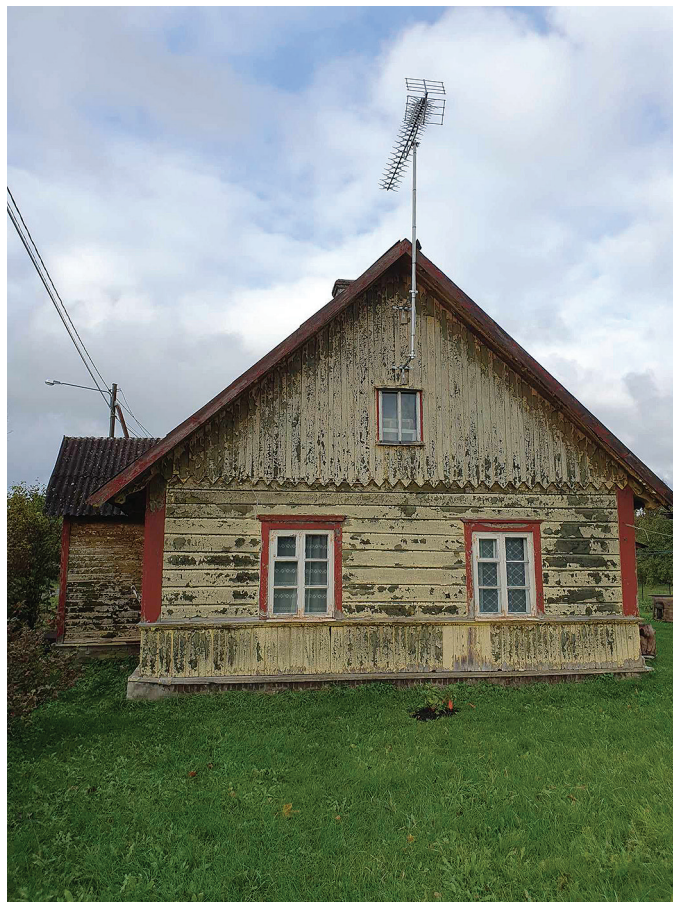
Sipa tee 8 hoonel on säilinud puitpits, endisaegne korstna kuju ja kahtepidi laudis.