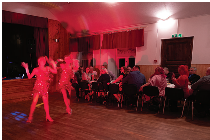
Bändi vahepauside ajal esinesid kabareetantsijad.