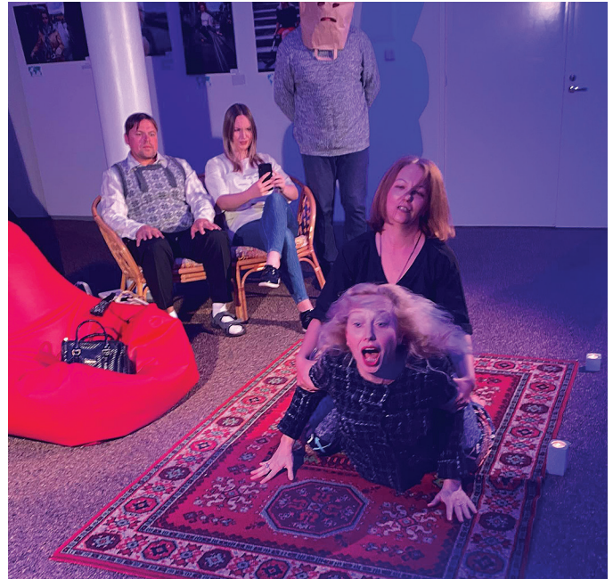
Foto etendusest „Muretsevad eestlased“, kus parasjagu on käsil tervendamine.

Öö oli rahulik, välja arvatud see, et rahvamaja aknast välja vaadates oli näha, kuidas puud üha rohkem tuule käes kõikusid ja maja ise ka nagises ja