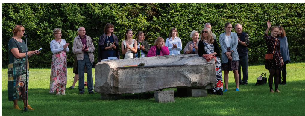
Muusika- ja kunstikooli tööpere kooli kõrval oleva dolomiidist klaveri juures.