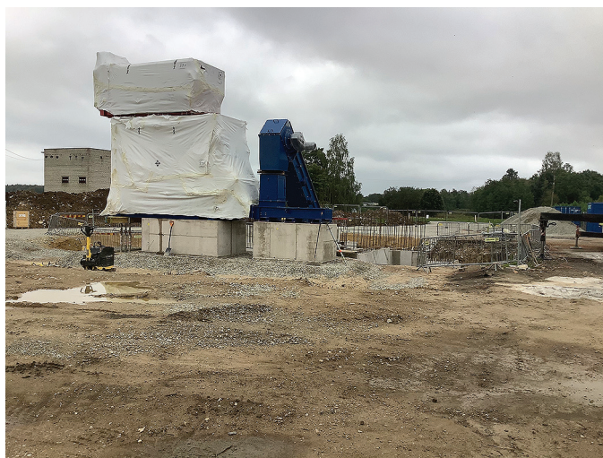
Orgita küla uue katlamaja ehitus.