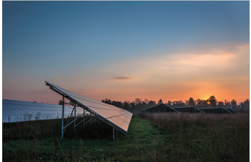
Keskkonnasäästlik energia. Päikesepaneelid Sõtkes külas.

Kui inimene soovib aga enda kinnistule püstitada päikeseparki või tuulikut, mis