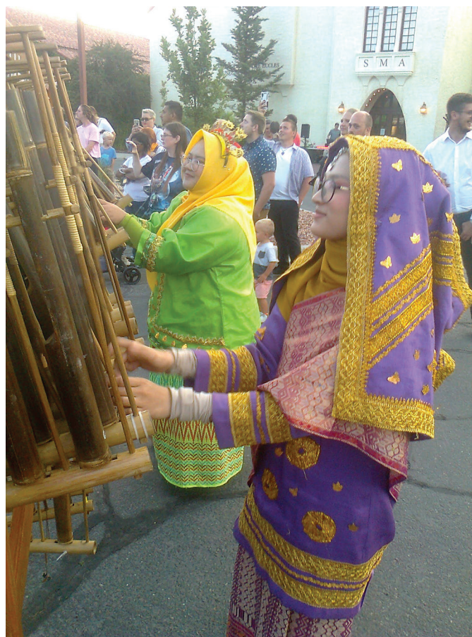
Neiud bambuspillide ja kirevate riietega Indoneesia rühmast Tim Muhibah Angklung.

misel päeval Alaska Airline'i lennuga Seattle'i lennujaama. Seal kulus ootamiseks jälle palju tunde. Kui kella neljast Finairi kassasse läksime, selgus, et meid ei oota seal keegi ja jälle tuli asja ajama hakata. Vaatamata sellele, et lennul oli kohti ja kassanäitsikud mõistsid meie muret, pardapileteid meile siiski ei antud. Kulustund ja kellaosutid muudkui liikusid. Lebasklesime suures lennujaamas, noored kuulasisid Leila Milleri laulu „Kodu“.