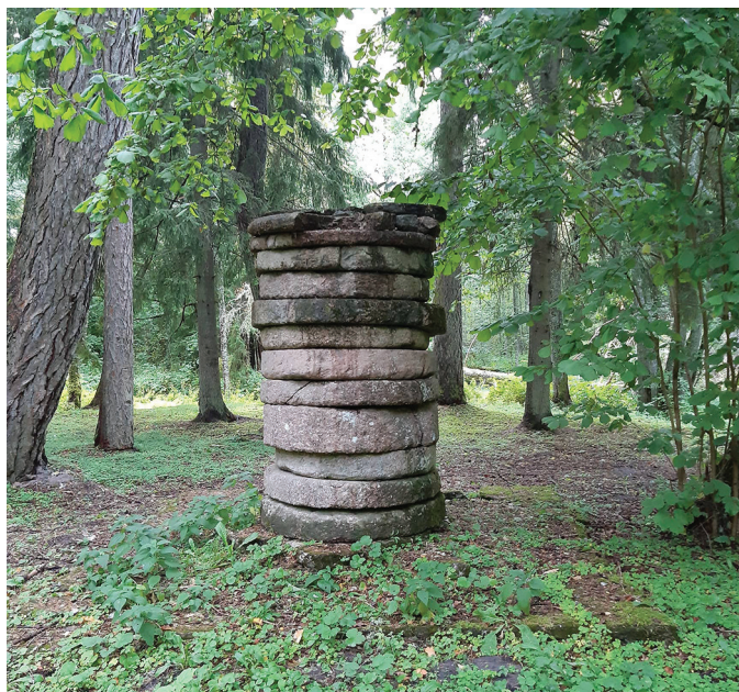
13 veskikivi Lisette saarel.

Vana-Vigala mõis on teadantuntud huvitav külustuskoht. Imetleti korrastatud mõisat ja selle ümbrust. Mõisa omanikest Üxküllidest on ka palju põnevaid lugusid rääkida. Kiriks tordil on muidugi Pompei linna väljakaevamistelt toodud kaks marmorist barlejeefi, mis on ühed vanimad kunstimälestised Eestis. Kõige paelumaks osutusid siiski jutud kummitustest mõisas. Need osutusid nii mõjuvaks, et viimane üksinda keerdtrepi juurde jäänud tundis lausa füü-