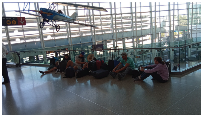
Tagasiteel tuli lennujaamades üksjagu oodata.

Meie probleemiga tegeldi, aga aeg kulus ja lennuaeg lähenes. Kas tõesti jääme jälle maha? Lõpuks tulid mingid piletid ja esimesed said loa minna lennule. Kiiresti tuli asuda teele lennujaama teise otsa. Kärmed jalad viisid sihile. End lennuki toolidel sisse seades saime sõnumi: „Ärge meid oodake, läheme teise lennuga. Meid ootab hotell ja homme alustame algusest.“