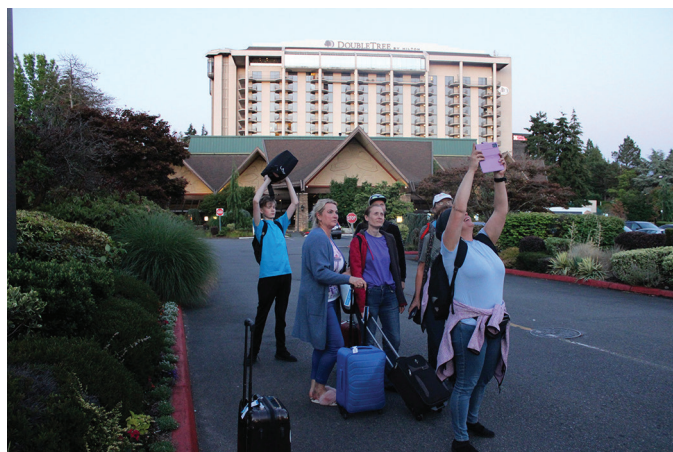
Just sellel seltskonnal õnnestus seigelda Ameerikas põhjalikult ning külastada ka Chikagot.