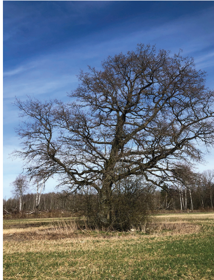
Hiimetsa tall 2021.

2. Niinema niinepuu (pärn). Puu asub tänases Lääne-Nigula vallas, vaid paarsada meetrit Märjamaa valla piirist. Teenuse piirkonna inimesed, kel tihti ka Kullamaale asja, teavad seda Niinema ohvripärna nime all. Puu asub Teenuselt nappi 3–4 kilomeetri kaugusel Silla-Jädivere tee ääres Niinema talust üle tänase maantee. 17. augustil 2022, kui tegime matka Sassi-Jaani talukohale, põikasime matka lõpus ka ohvripärna vaatama.