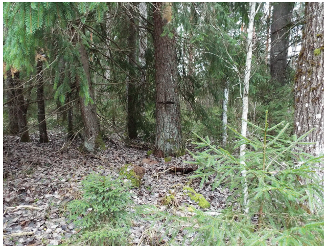
Budbergi mänd ristiga

3. Salatsi künnapuud asuvad endise Jõeääre küla Polli talu maadel, Teenuse-Altküla teel. 1937. aastal selgitab Looduskaitse nõukogu otsus asukohta nii: „Polli talu Salatsi-oja põllu serval, Teenuse jõe ääres umbes 75 m jõe paremast kaldast”. Tuligi ette võtta väike matk Polli talu maadele, kust leidsin ka kirjeldustele vastavad künnapuud. Samuti leidsin loodusest võimaliku Salatsi oja asukoha, mida tänastelt kaartidelt küll ei leia (Nõukogude-aegse maaparanduse käigus kogu piirkond kraavitatud).