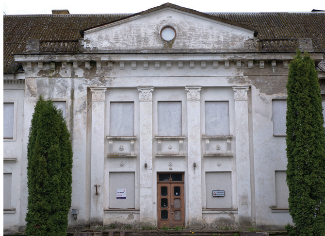
Arutelud Oru 2 hoone teemal jätkuvad.

Kui Muinsuskaitseamet hoone mälestiseks tunnistab, siis vähendaks see tunduvalt võimalusi, et Oru 2 lugu ükskord positiivse lahenduse saaks. Vähemalt pikendaks see kogu protsessi teadmata ajaks, halvemal juhul ootaks seda hoonet alevi asuva nn vene kiriku, kaitseliidu maja ja mõne muu pikalt kasutuseta jäänud objekti saatus.