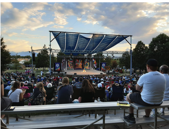
Word Folkfesti esinemispaik The Arts Park.