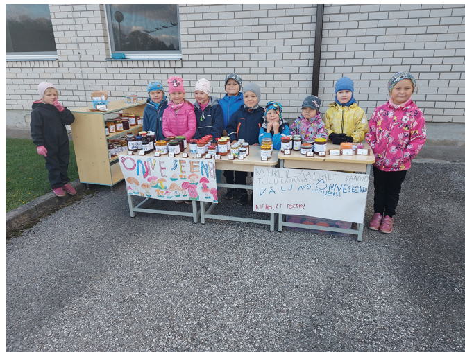
Õnneseente rühma müügilet.

Kuid ega asi siis moosidega piirdunud. Nagu esmamulje lubas – leida võiks kõike! Nii nagu korralikul laadal ikka, ei puudunud sealtki tordid-koogid, hoidised, ehted, aiasaadused, taimed, jäätis ega isegi suhkruvatt. Ja millised hinnad! Millal te saite viimati 25 senti eest