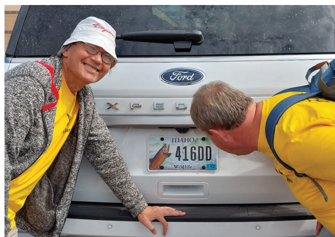
Piirkondlik autonumber väärrib lähemalt uurimist.