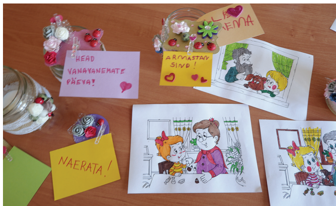
Vanavanemate päeval sai pilte värvida ja meisterdada.

kuhja pannakooke ja soovitas kodust kaasa võtta moosi. Nii saigi kookidele erineva mekiga moose peale panna. Võimalus oli kaunistada purke, kuhu pärast küünal sisse panna. Sai mängida lauamänge, lahendada ristsõnu ja sudokusid või värvida pilte. Mõnedki ütlesid, et nad pole enam aastaid mänginud „Tsirkust“ või „Reisi ümber maailma“, ja veel kaugemas minevikku on jäänud piltide värvimine.