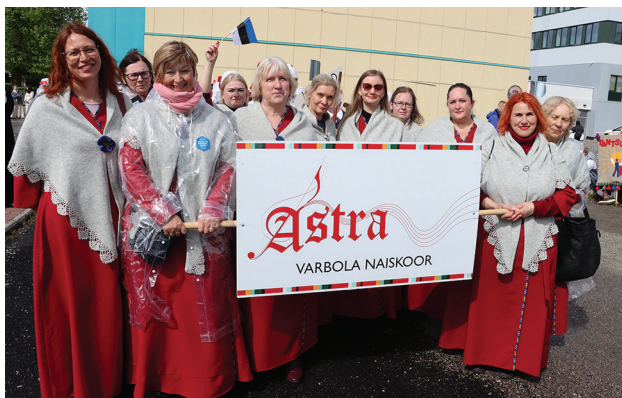
Hei laulunaine, ootame sind laulma Varbola naiskoori Astra!

Kui oled vanuses 18+..., tule 10.10.2022 kell 18.00 Varbola rahvamaja esimesse proovi. Teretulnud kõik häälerühmad.