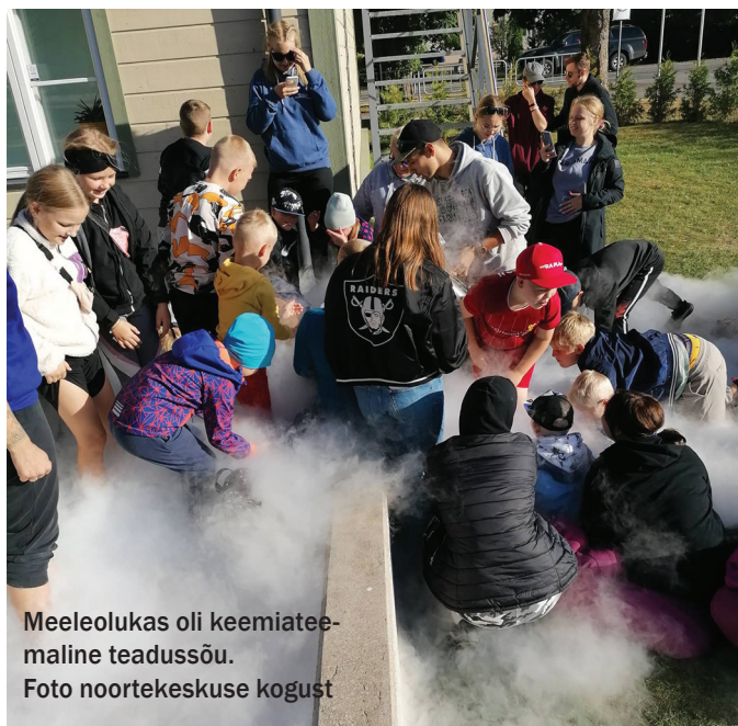
Meeleolukas oli keemiateemaline teadussõu.