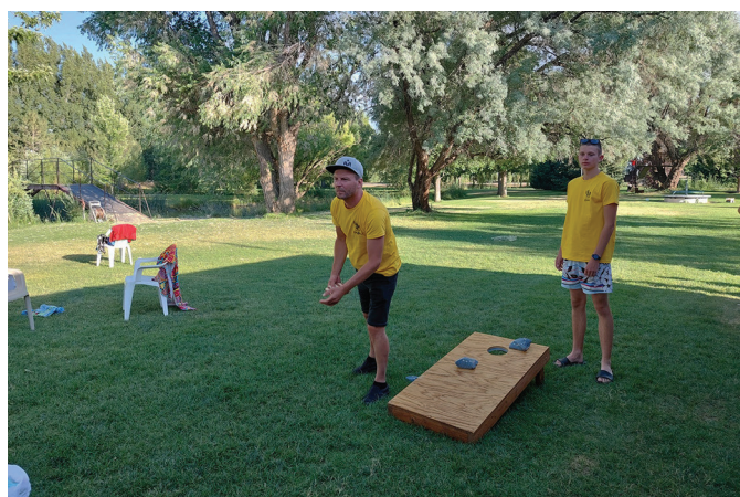
Maisikoti viskamise mäng.