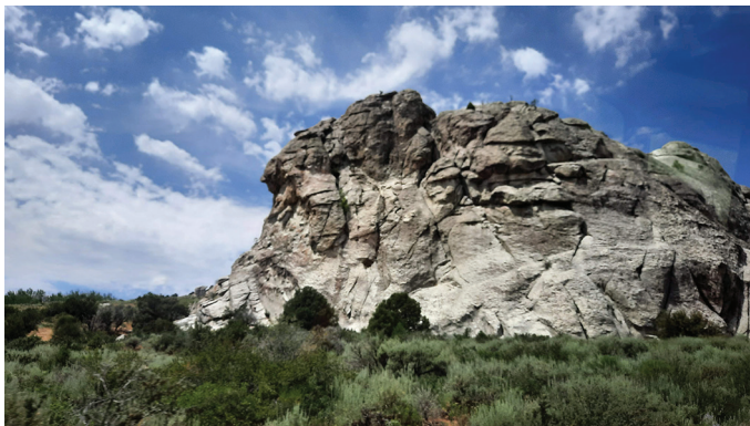
City of Rocks on looduslikke kiviskulptuure tulvil.