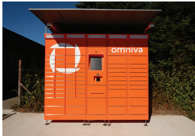
Pakiautomaat Kivi-Vigalas on käidavas kohas – rahvamaja ja kaupluse juures.

Saadetisi saab saata Omniva pakiautomaatidesse Eestis, Lätis ja Leedus, postkontoritesse või tellida kulleriga kohale viimine. Lisaks saab pakiautomaadist saata kuni L-suuruses pakki ka mujale Euroopa Liidu piires. Omniva pakiautomaadid asuvad õues ja on ligipääsetavad kellaajast ja nädalapäevast sõltumata. Pakiautomaat juba töötab ja pakke saab saata ja saada.