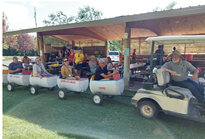
Päeva naelaks kujunes sõit pereisa poolt valmistatud rongiga – veduriks ATV ja vaguniteks ülisuured plastikkanistrid.