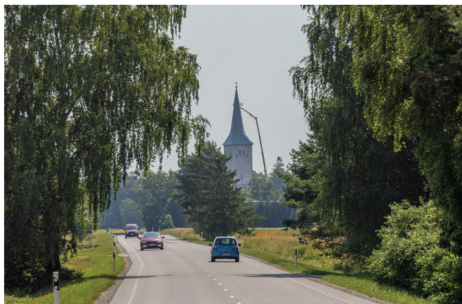
Suvel sai uue värvikorra Märjamaa kiriku torni plekkkatus.

Kaks siinse valla kirikut – Märjamaa ja Vigala – on saanud ka peatuspaigaks Püha Jaakobuse palverännuteele. Eelmisel aastal maha märgitud marsruut suundub Tallinnast Riia poole. Tulevikus peaks seda mööda jõudma välja Santiago de Compostelasse Hispaania läänerannikul. Tä-